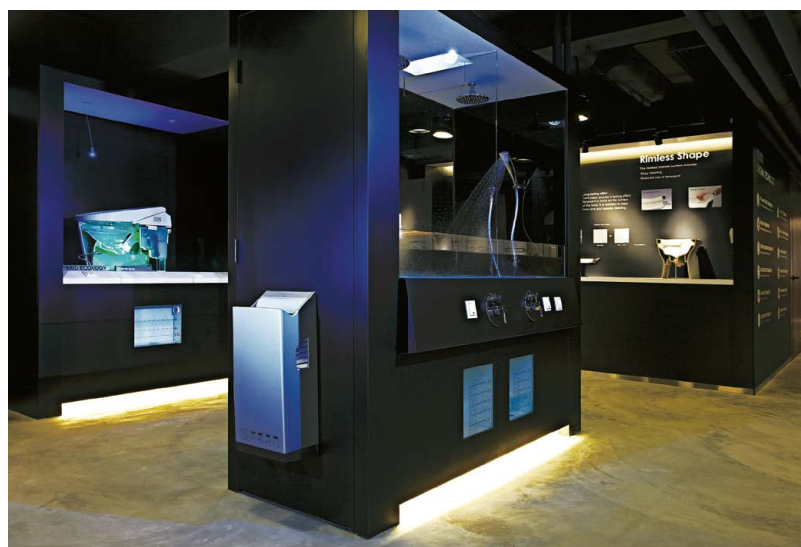
Technical Zone各式陳設讓顧客對TOTO產品背後的高科技技術有所了解。