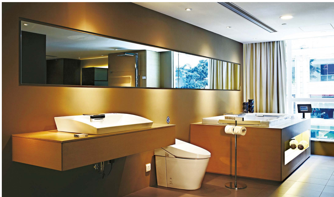
(左至右) Neorest SE面盆備自動出水功能，融入SMA恆溫技術；Neorest A座廁為全自動智能廁所，蓋板自動開關，如廁後自動沖水，另備洗淨、除臭，以及暖風吹乾功能；Neorest SE浴缸有4個水魔力噴咀，10個氣泡按摩噴咀，備輕觸式操控屏幕。