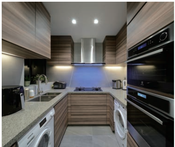
廚房：廚櫃採U形編排，鋪設易於打理的灰色石紋地磚，與石英石工作檯面匹配。