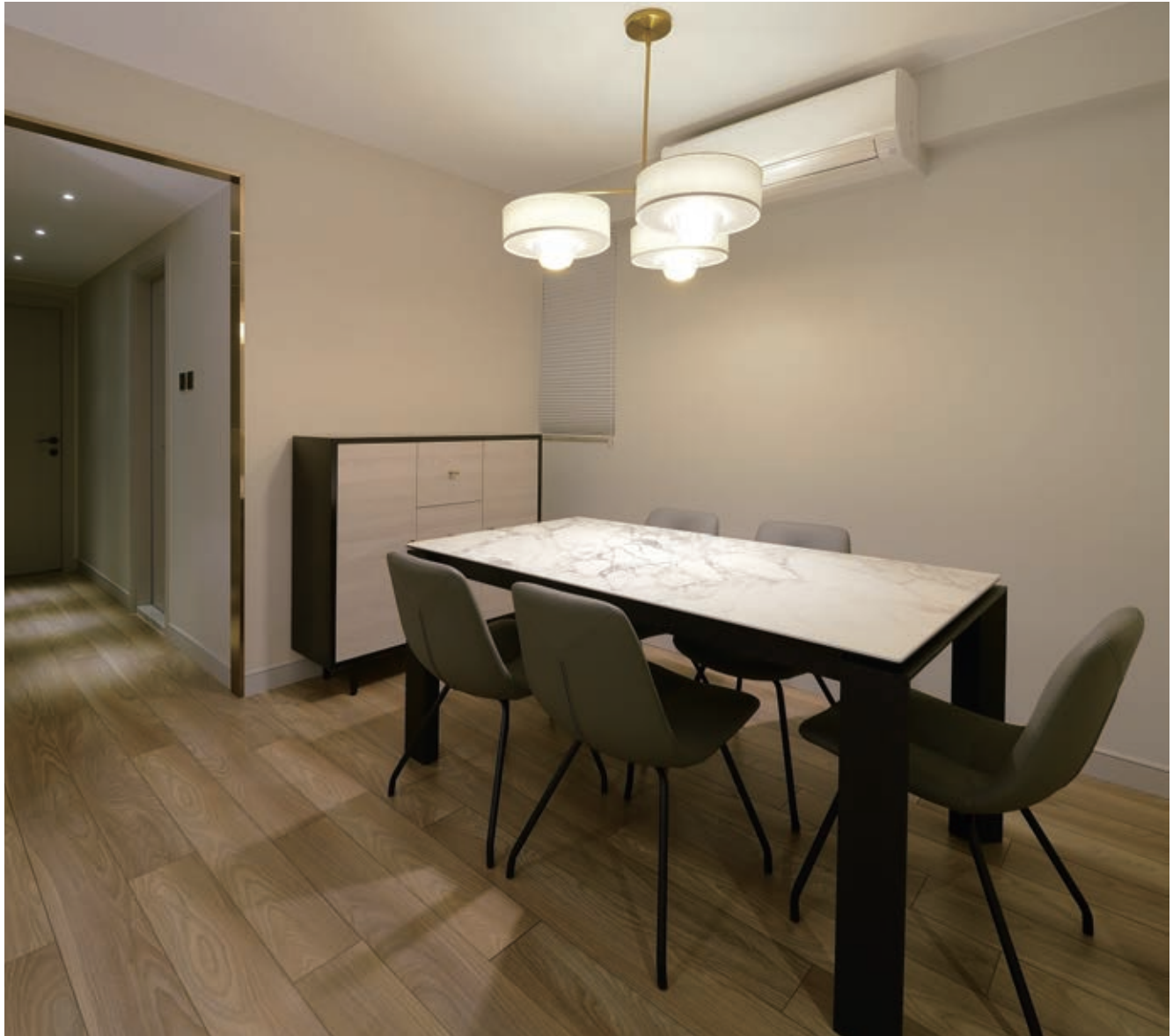
除了走廊門框，飯廳吊燈及櫥櫃手挽均見香檳金細節，藉以點綴布置清簡的飯廳。