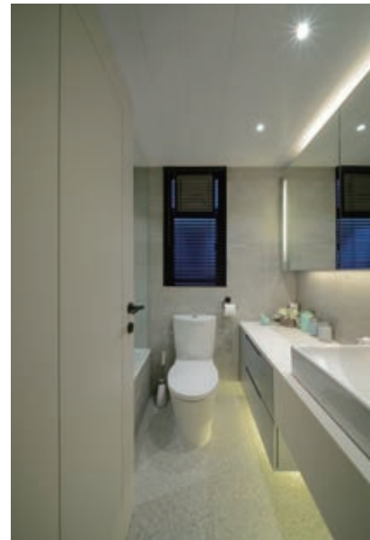
客廁選用長方臉盆，感覺利落；浴缸側設玻璃隔屏，防止水花濺出。