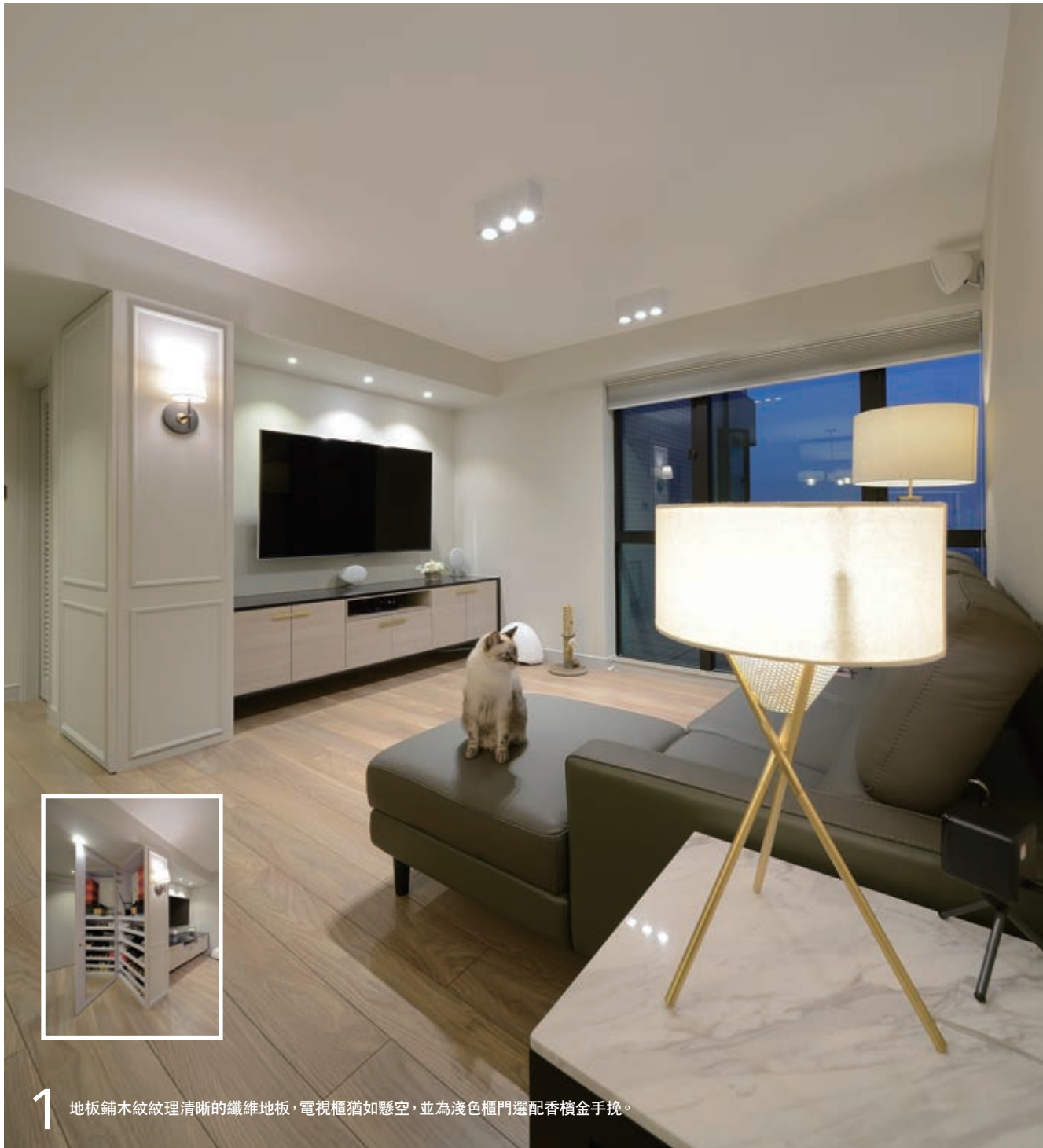
1 地板鋪木紋紋理清晰的纖維地板，電視櫃猶如懸空，並為淺色櫃門選配香檳金色手挽。

夫婦二人不常下廚，便把廚房改作開放式，連繫餐廚兩區。大廳牆身髹上淺灰色油漆，鋪木紋紋理鮮明的纖維地板，與色調略深的下廚空間區別開來。