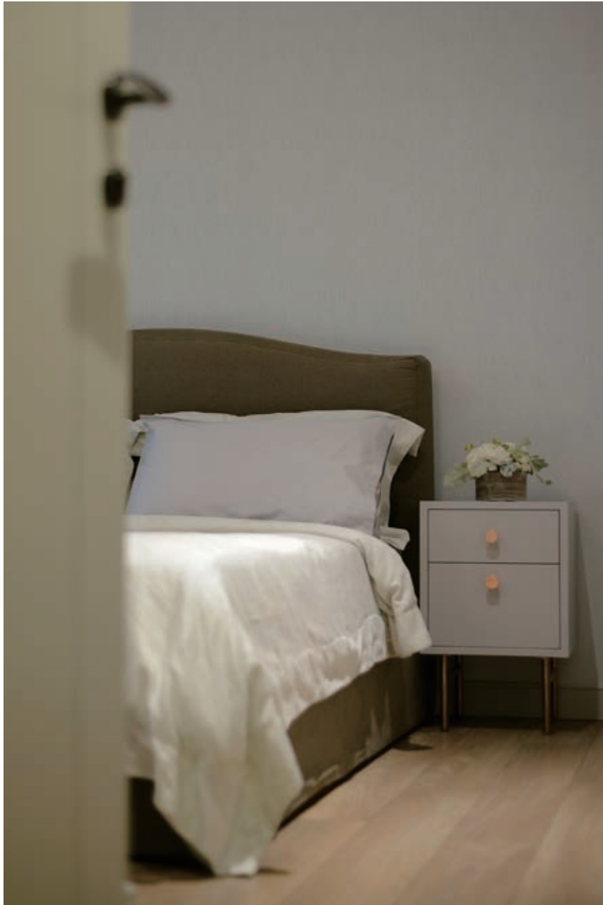
以灰和木色鋪陳臥眠氣氛，木紋纖維地板自大廳延伸至主人房，暖意洋溢。