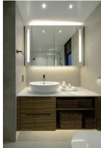
套廁：增設鏡櫃以擺放盥洗用品，鏡櫃上下加入滲光效果，令櫃組看起來更輕盈。