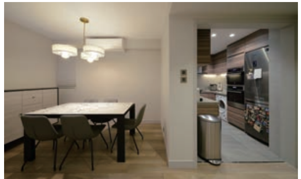
3 廚房改作開放式，餐廚兩區的用色一深一淺，卻不離灰和木調的組合，觀感和諧。