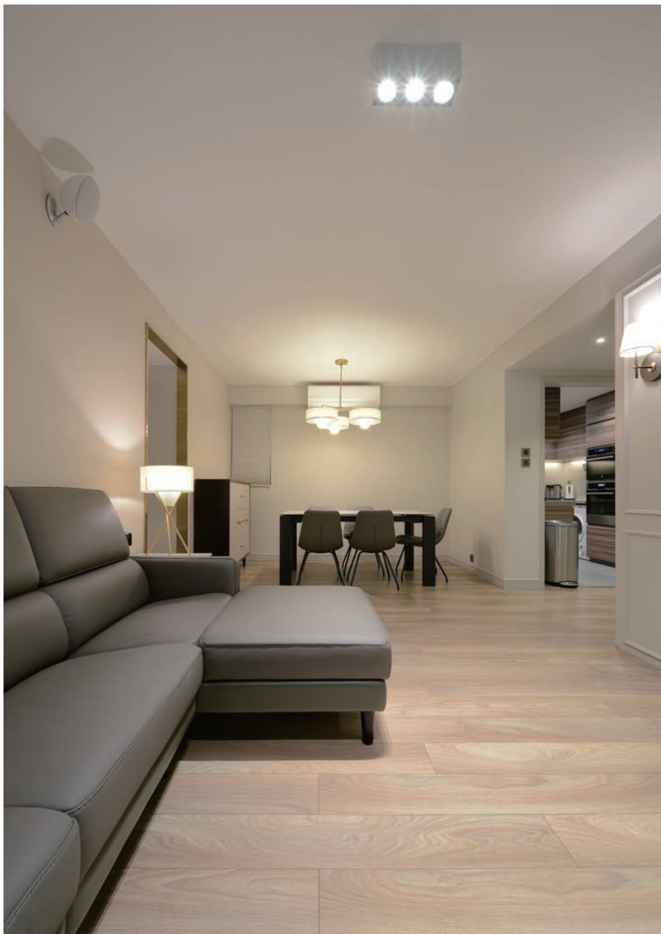
拆除廚房間隔牆後，空間更見開闊，戶主的愛貓便能無拘束地自在走動。