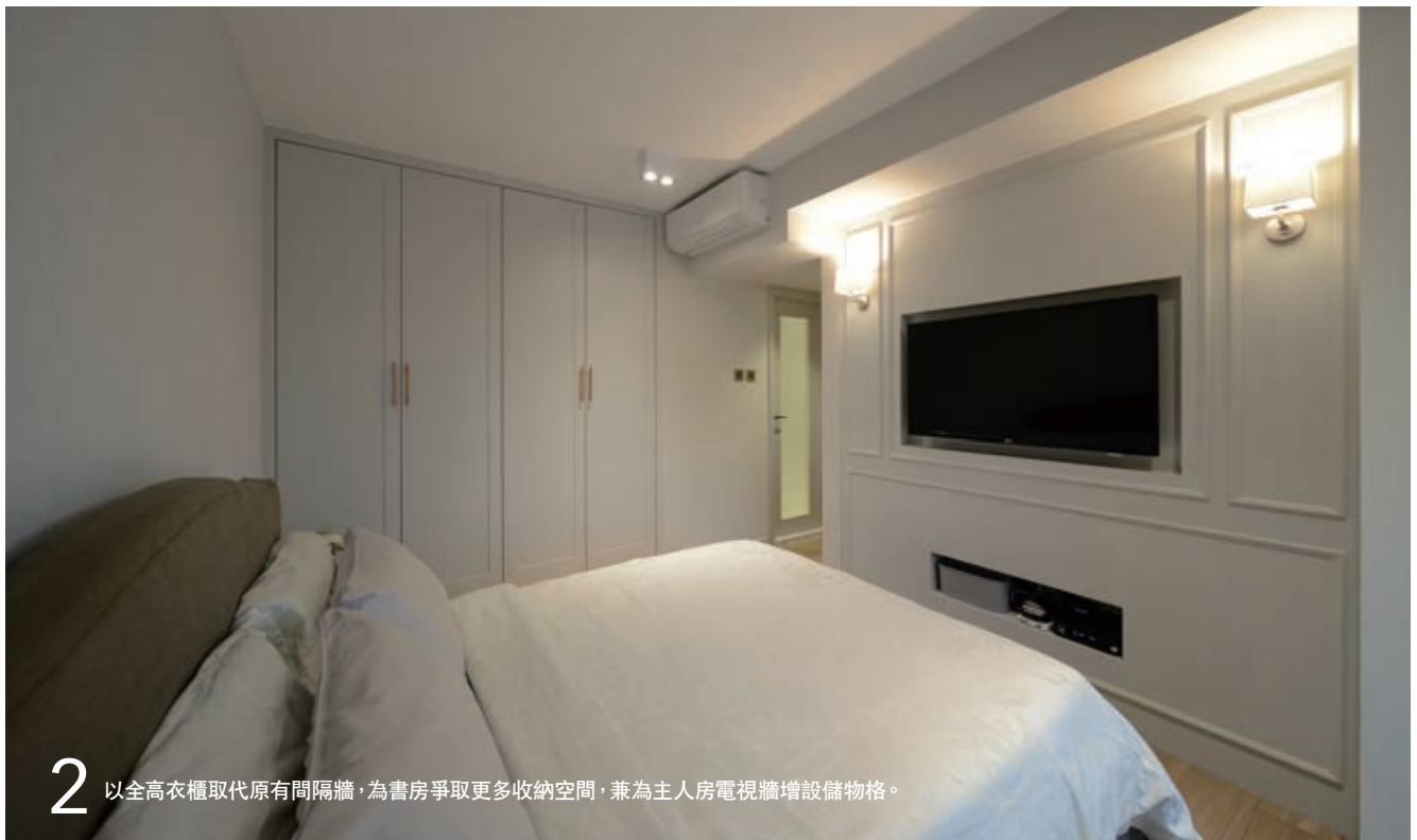
2 以全高衣櫃取代原有間隔牆，為書房爭取更多收納空間，兼為主人房電視牆增設儲物格。