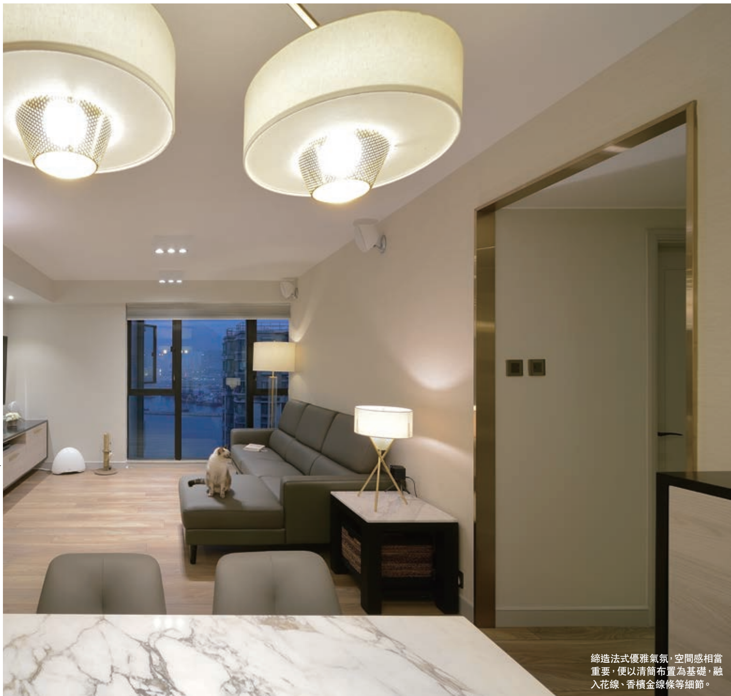
締造法式優雅氣氛，空間感相當重要，便以清簡布置為基礎，融入花線、香檳金線條等細節。