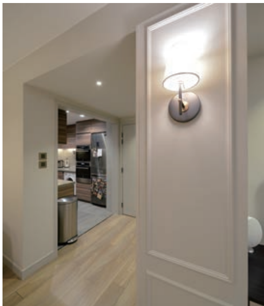
玄關鞋櫃不單解決儲物需求，兼把原有間隔的凹位巧妙修正。